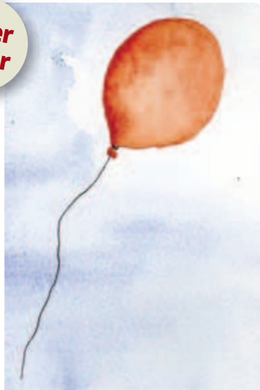
Illustration: Gunilla Lundh-Tobiasson